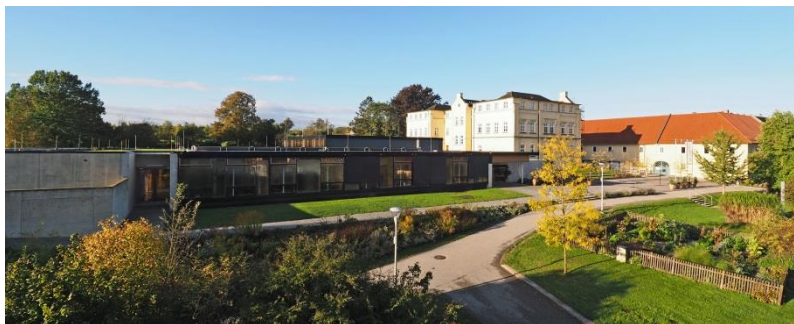
Abbildung 1: Gartenbauschule Ritzlhof